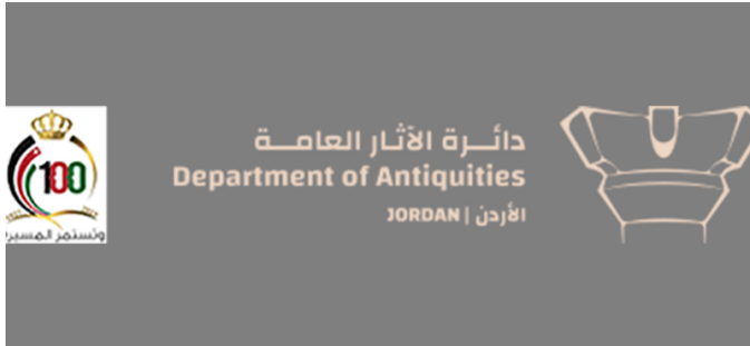
Department of Antiquities of Jordan (DoA)