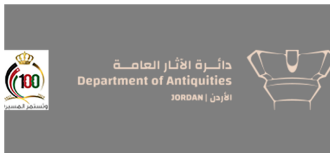
Department of Antiquities of Jordan (DoA)